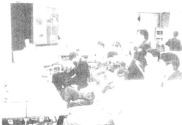
図3 仮想空間ゲーミング

次に、記述式で回答を求めた問6から問9についていくつか特徴的な意見を紹介する。まず、