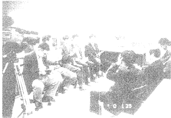
図2 実空間ゲーミング

抽象世界での経験を現実世界に結びつける。遠隔マルチメディアを利用したコミュニケーションおよびその教育利用について考える。プロフィールゲームの特徴は、いわゆる自己紹介に加えて、他者の特徴と名前を結びつけるという知的作業が要求される点である。しかも、