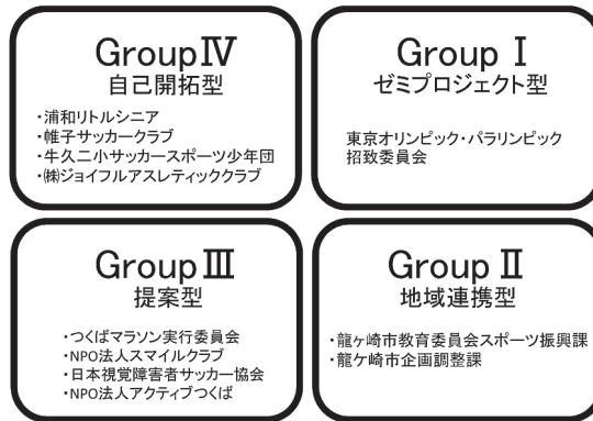
図1 実習先のグループ