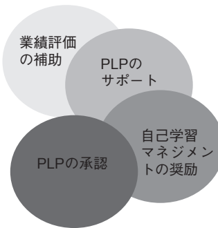
図3 メンタリングの4段階