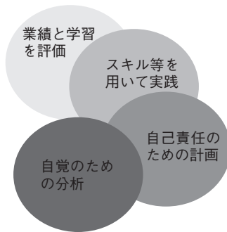
図2 コーチ・メンタリングの4段階