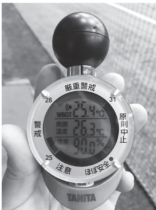
図1 WBGT計 (TT-561, TANITA製) の外観と表示画面