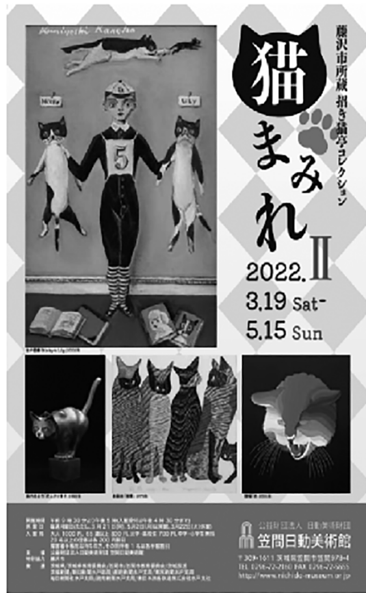
「藤沢市所蔵 招き猫亭コレクション 猫まみれⅡ」 のポスター・笠間日動美術館（2022年3月）

本稿では、そうした接尾辞「だらけ」と「まみれ」についての用例を調査し、まとめる。